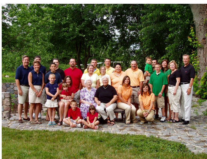
Современная американская семья, включая всех родственников, среднего класса со Среднего Запада [32]