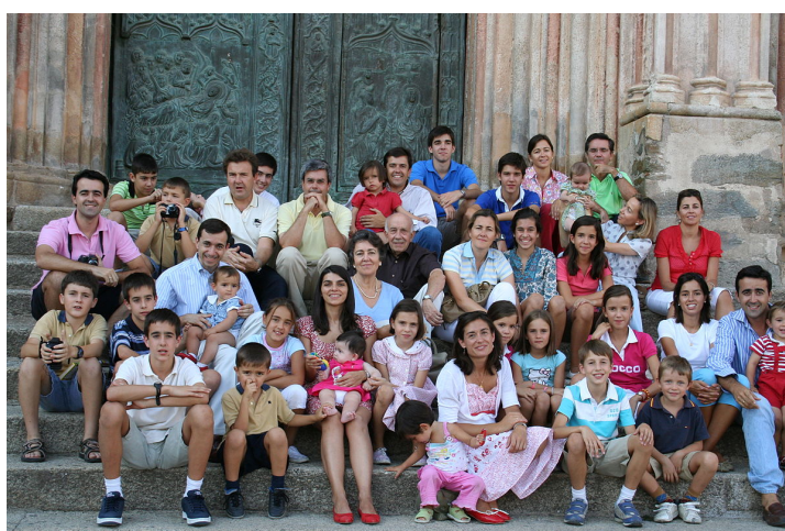
Современная испанская семья, включая всех родственников [33]