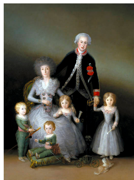
Старинная семья (картина Франсиско Гойя)

Изменились и социально-психологические установки на рождаемость. С суждениями, что «долг каждой женщины стать матерью» и «долг каждого мужчины растить детей» гораздо чаще соглашаются представители старших, нежели младших поколений. Особенно заметны сдвиги в установках женщин. На вопрос «Должна ли каждая женщина стать матерью?» среди опрошенных в конце 1990-х гг. петербургских женщин от 18 до 29 лет утвердительно ответили лишь 20 %, а среди 30-39-летних — только 17 %. Это значит, что материнство, которое религиозная мораль всегда считала главной ипостасью женщины, становится лишь одной из её социальных идентичностей. В представлениях россиян о справедливом распределении семейных функций и об обязанностях матери и отца традиционалистские установки борются с эгалитарными, сопровождаясь жёсткими взаимными обвинениями мужчин и женщин.