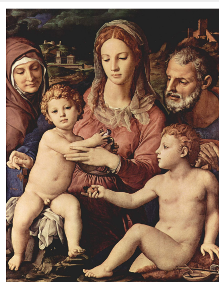
Святое семейство со святой Анной и Иоанном Крестителем. Картина Аньоло Бронзино, ок. 1530

До Второй мировой войны в России преобладала патриархальная семья , которая характеризуется преобладанием мужчины в доме и подчинением ему всех остальных членов семьи. В послевоенные годы, начиная с конца 40-х годов до 80-х, доминирующей стала детоцентристская семья , в которой очень большое значение придаётся благополучию детей и сохранению брака в интересах детей. Совсем недавно в последние десятилетия возникла супружеская семья , в которой доминируют равноправные отношения, стабильность брака зависит от желаний и качества отношений между супругами. Экономическая самостоятельность женщин, повышение их социального статуса неизбежно предполагает иной — партнёрский тип супружества . Многие исследователи отмечают изменение функций семьи в сторону её большей психологизации и интимизации. В 20-м веке произошёл переход от брака по расчёту или обязанности к браку по любви. С одной стороны, как отмечает И. С. Кон — это огромное достижение человечества, но с другой стороны, такой брак предполагает большую частоту расторжения браков по психологическим мотивам, таким, например, как «несходство характеров», что ведёт к меньшей устойчивости браков. Как отмечает Кон, главная тенденция, лежащая в основе всех этих процессов — изменение ценностных ориентаций , в центре которых ныне стоит не семейная группа, а индивид. [28]